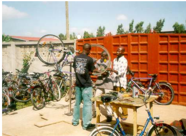
Fahrradworkshop 2002 in Accra/Ghana

Die Schulkinder kommen aus sehr großen Entfernungen. Das ist sehr zeitaufwendig und überfordert sie körperlich und mental. Somit werden die schulischen Leistungen beeinträchtigt und die Bevölkerung der Massai wird weiter an den Rand gedrängt. Fahrräder können helfen, Zeit zu gewinnen und die Leistungen zu verbessern. Dadurch wird auch mehr Zeit sein, um zu Hause zu helfen. Die Zielgruppe welche von den Fahrrädern profitieren, sind Schulkinder zwischen 5 und 18 Jahren. Jungen Männern und Frauen soll die Möglichkeit gegeben werden, sich mit einem Fahrrad selbständig zu machen. Darüber hinaus sollen die Fahrräder Gesundheitsdienste und die HIV/AIDS Aufklärungsarbeit unterstützen. Ein Teil der Fahrräder wird darüber hinaus an Kenianer weitergegeben, die sie besonders dringend benötigen, wie zum Beispiel: Subsistenzlandwirte, Freiwilligenhelfer, Sozialarbeiter, Barfußärzte, NGOs, Frauen, die sprichwörtlich „die Hauptlast tragen“.